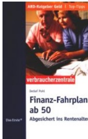
ARD-Ratgeber Geld, Verbraucherzentrale (Hrsg.), „Finanz-Fahrplan ab 50“, 249 Seiten, 19x12 cm, ISBN 3-938174-02-1, 9,80 Euro.

Der Ratgeber ist für alle lesenswert, die sich nicht in der Lage von Wim Duisenberg, dem ehemaligen Präsident der EZB befinden (wollen): Auf die Frage, wie er sein Geld anlegt, bemerkte er „Ich persönlich bin in der glücklichen Lage, keine Reserven zu haben.“