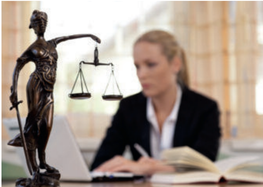
Schon jeder zweite Vermittler benötigt mindestens einmal im Jahr juristischen Beistand – sei es wegen einer Regulierungsfrage oder Problemen mit Kunden. Nicht in allen Fällen muss man sich dazu an einen Rechtsanwalt wenden.

Vermittler brauchen immer häufiger juristischen Rat. Den erhalten sie nicht nur beim Anwalt, sondern mitunter auch bei ihrem Pool oder dem Berufsverband.